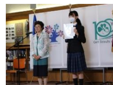
昨年度授賞式の様子

第4回コミュニティアクション チャレンジ100アワード入賞者の授賞式と活動発表をおこないます。